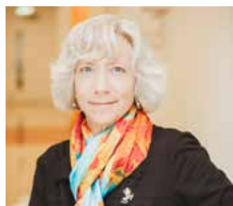
DR. GRETCHEN C. DAILY

El trabajo innovador de Daily de un previsión del cambio de la biodiversidad, y la estimación del valor de los ecosistemas y sus servicios, que inició cuando era un estudiante de doctorado, cuando los científicos típicos de conservación justificaron sus esfuerzos para conservar la naturaleza simplemente por el valor de su existencia. Sus proyectos arriesgados de investigación no clásica tienen ideas que han transformado nuestra forma de pensar acerca de la conservación.